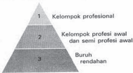
Stratifikasi sosial masyarakat industri berdasarkan kriteria profesi.